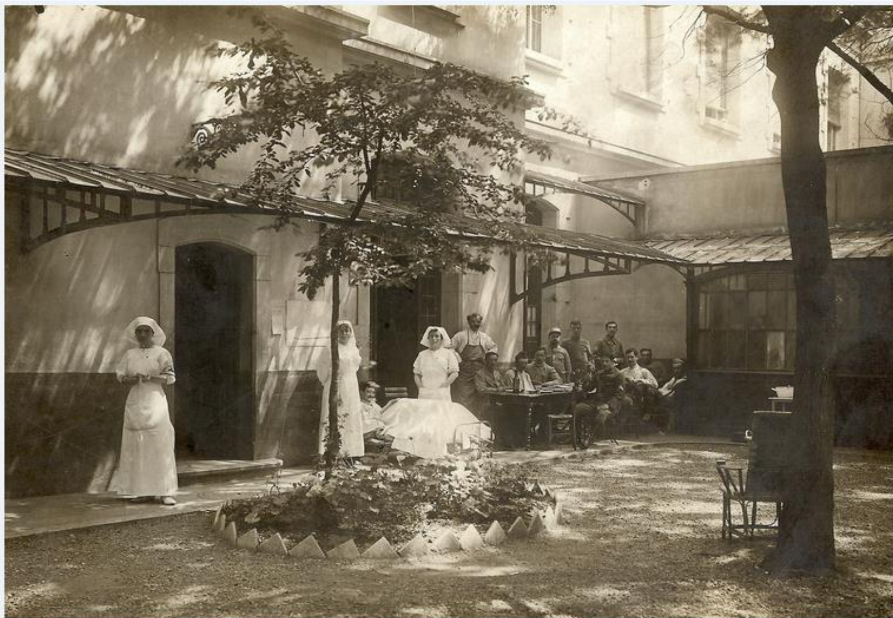
Cour centrale (Porte « Chat »), entre 1916 et 1920