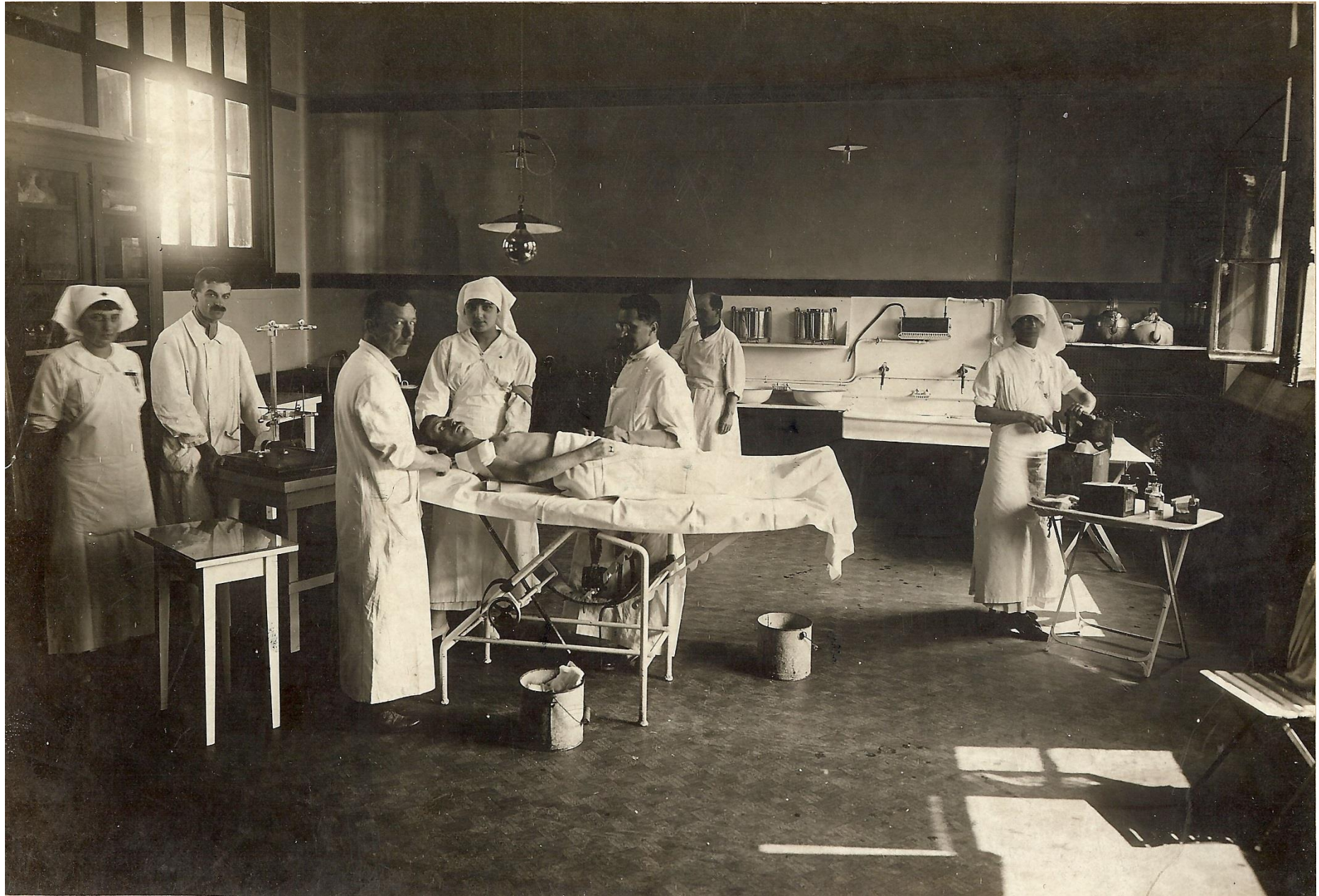
Une salle d'opération, entre 1916 et 1920