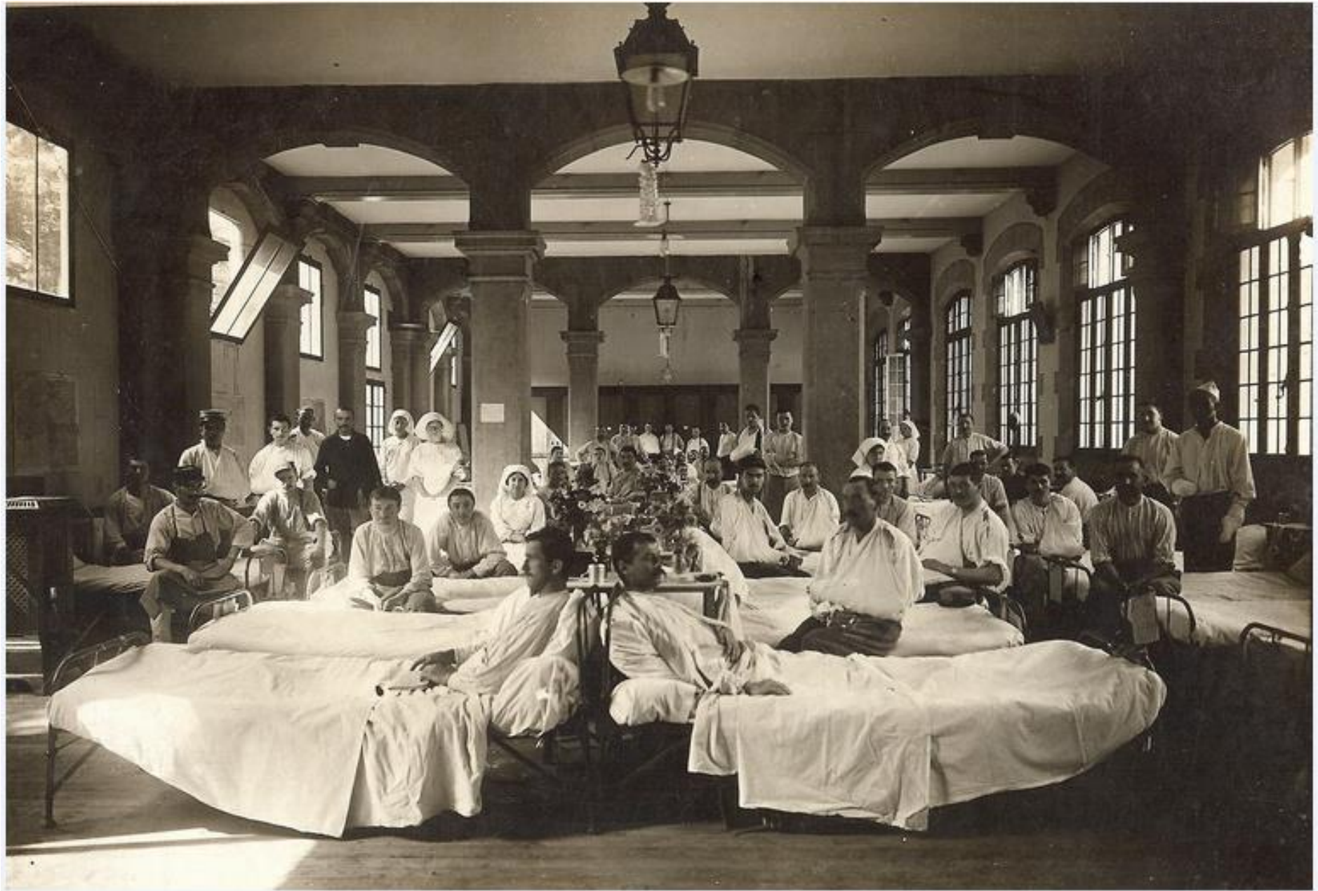
Préau côté Denfert-Rochereau, entre 1916 et 1920