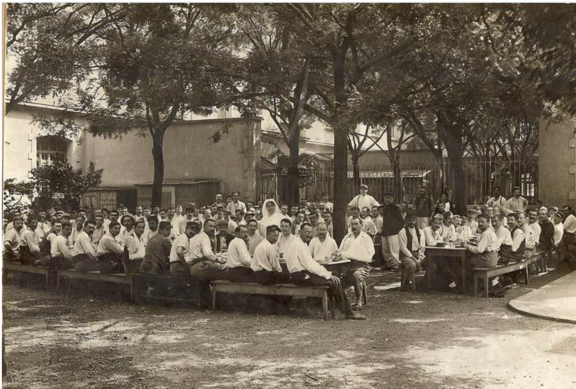
Cour côté Denfert-Rochereau, entre 1916 et 1920